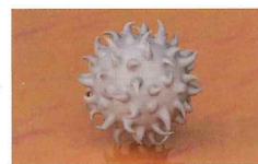
時間とともに抑制され、6時間以上経過すると90%程度※1が抑制されます。