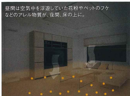
昼間は空気中を浮遊していた花粉やペットのフケなどのアレル物質が、夜間、床の上に。

パナソニックのアレルバスター配合塗装の床材は、人や空気の動きの少ない夜間、床面に落ちてくるアレル物質を広い床面全体で受け止め、効率よく抑制します。